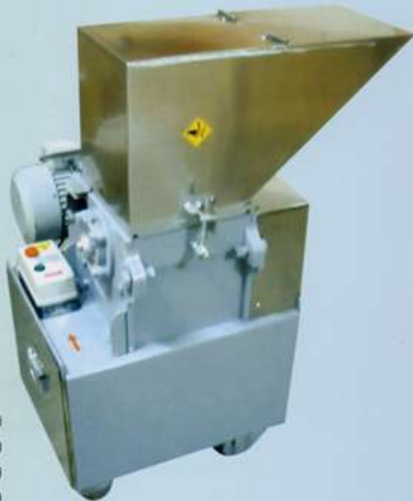
C-S210 C-S260 C-S310 C-S420