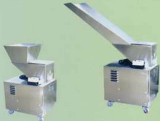
活動滑道及加高料斗